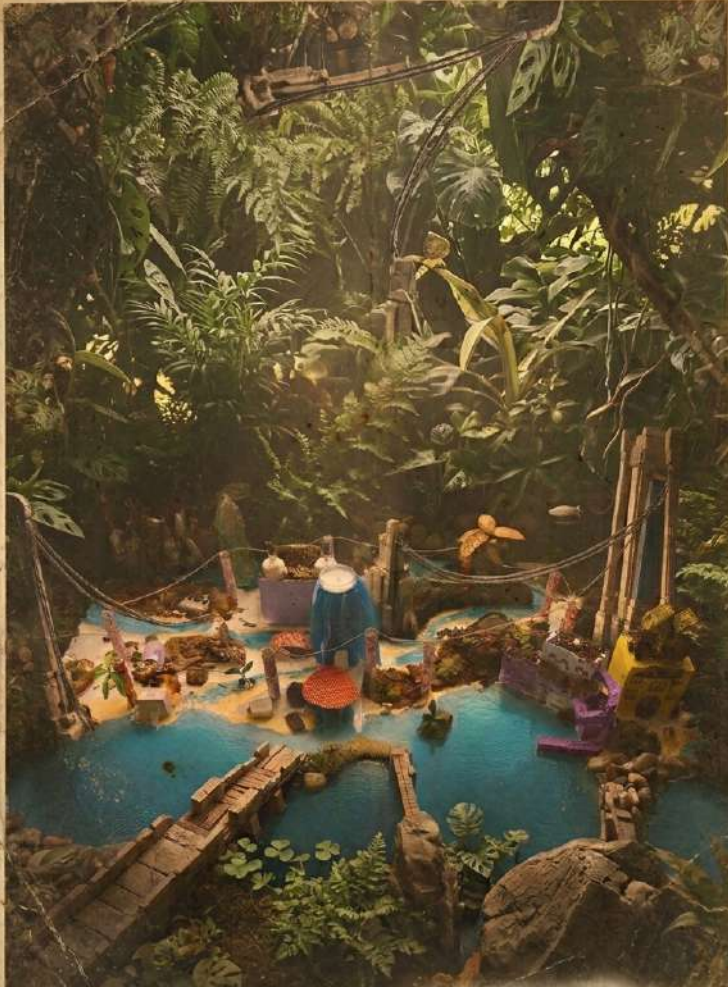
PLAN DÉTAILLÉ DE LA CITÉ KOSMODOM FIG.3