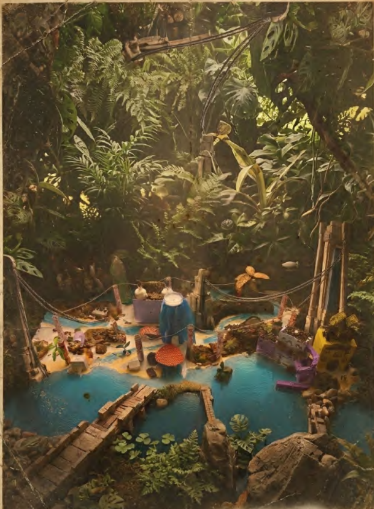
PLAN DÉTAILLÉ DE LA CITÉ KOSMODOM FIG.3